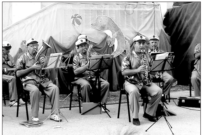
Духовой оркестр г. Судак на летней площадке ДК пгт Орджоникидзе

семейного отдыха. Приоритетным направлением работы нашего Дома Культуры является работа с детьми,