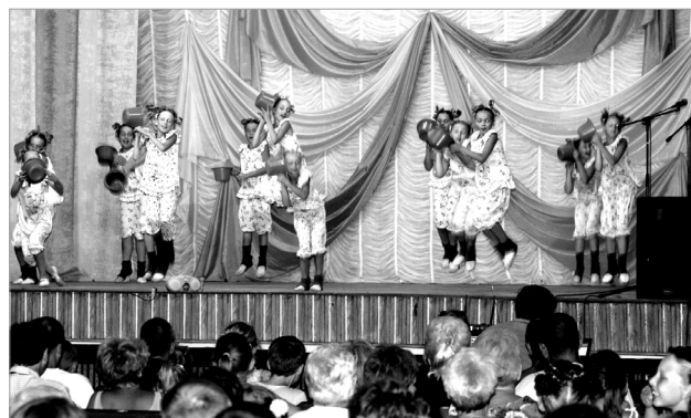
На сцене ДК - танцевальный коллектив «Румяные щечки» (г. Харьков)

Открыла фестиваль секретарь Орджоникидзевского поссовета