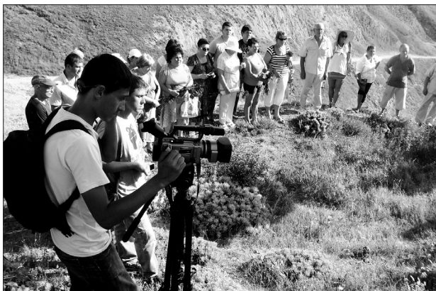
Открытие мемориальной доски