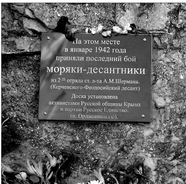
Мемориальная доска, установленная 22 июня 2012 года

22 июня в день памяти и скорби по жертвам, погибшим в период Великой Отечественной войны активисты Орджоникидзевской поселковой организации Русской Общины Крыма торжественно открыли мемориальную доску в честь группы матросов-десантников, которые храбро сражались с румынскими и немецкими подразделениями в январе 1942 года в районе «Чёртова моста» (поворот старой дороги на завод «Гидроприбор»).