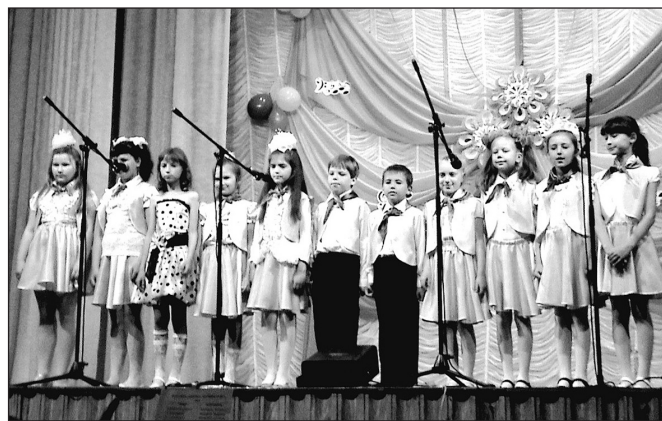
Хор «Радость» на сцене ДК пгт Орджоникидзе

Сегодня в ДК проводят свой досуг и развивают свои