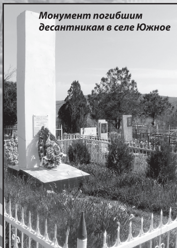
Монумент погибшим десанникам в селе Южное

по правую сторону старой дороги, если направляться по ней в сторону Орджоникидзе. Там они были оставлены под охраной на ночь, после чего их должны были расстрелять.