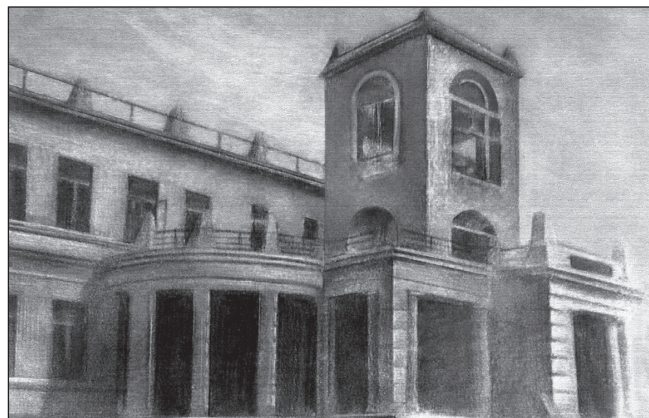
Дача вице-адмирала М.В. Бубнова Зарисовка с фото 1919 года.