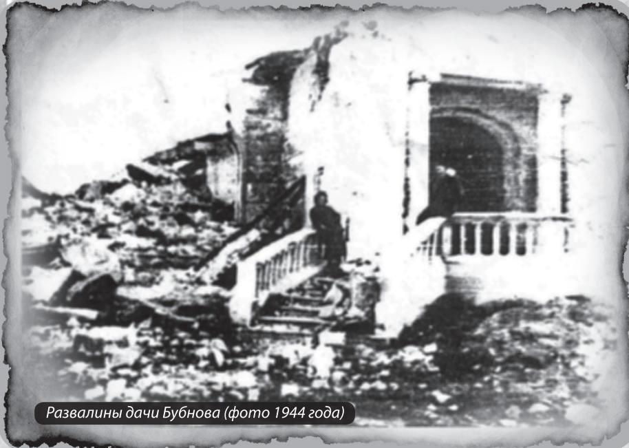
Развалины дачи Бубнова (фото 1944 года)

Ввиду гористого рельефа местности, особенно трудоёмкой была подготовка к строительству площадок, траншей под фундаменты, водоотводных устройств. Земляные работы выполнялись вручную многочисленной армией землекопов; вынутый грунт перевозился на подводах и сваливался в море.