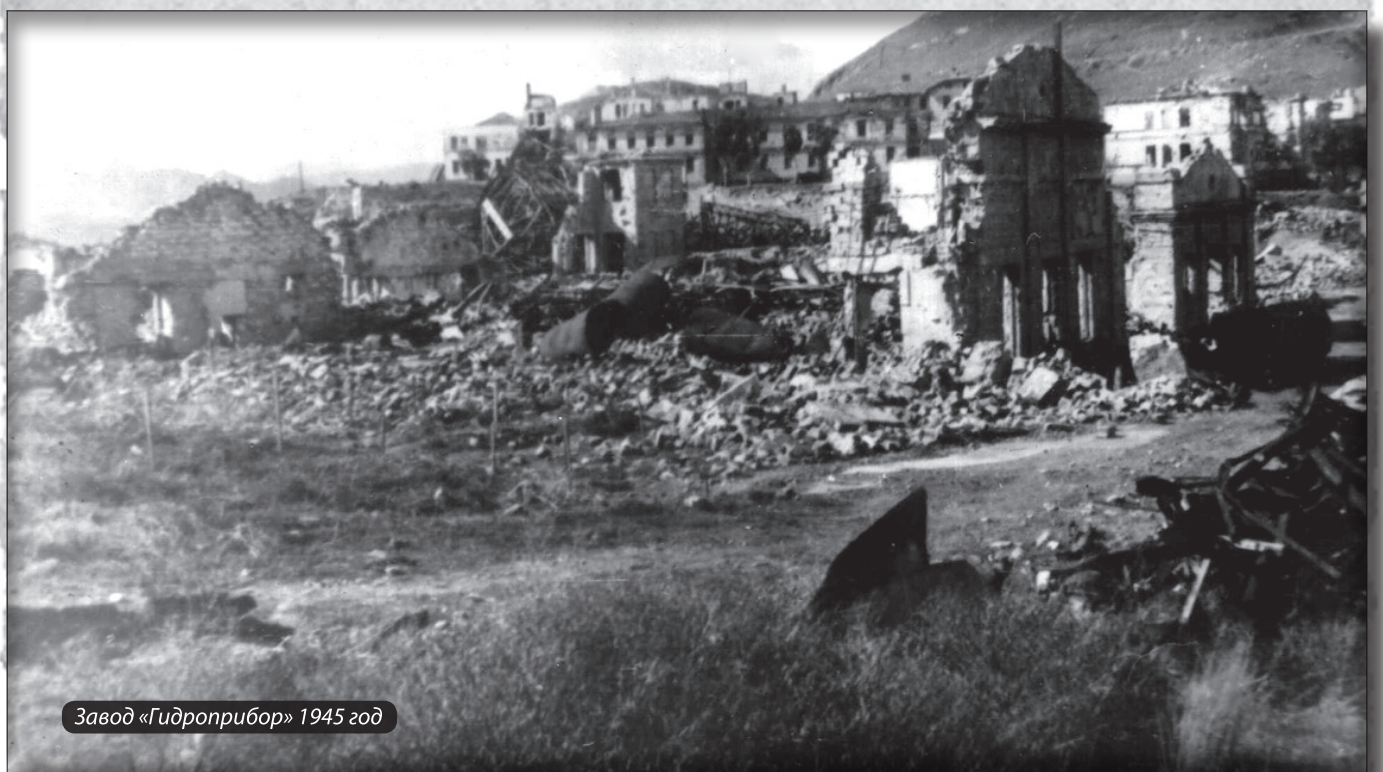
Завод «Гидроприбор» 1945 год

Посёлок «Бубновка» развивался очень медленно. Вначале были построены одноэтажные бараки без каких-либо удобств и только в 30-х годах стали строить 2-х этажные дома, более или менее удобные, для жилья. Жилищно-бытовые условия рабочих находились на низком уровне – завод на протяжении нескольких лет остро ощущал недостаток в жилье. Хотя и практиковалась аренда гостиницы в г. Феодосии и частных домовладений, площадь, приходящаяся на 1-го человека не превышала в жилых домах 5,3 квадратных метра. Но дорога от Феодосии была очень далека.