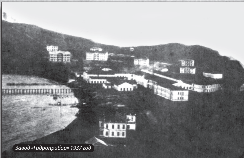
Завод «Гидроприбор» 1937 год

Съ 1913 года здесь сооружается большая минная станция акция. о-ва заводовъ Г.А. Лесснеръ. При станции, занимающей пристылкой минь, начато также сооружение большого завода, и въ кратчайший срокъ это глухое место преобразилось до неузнаваемости. Появились громадныя здания мастерскихъ, квартиры для рабочихъ и администрацій, школа, больница; устроенъ водопроводъ, электрическое