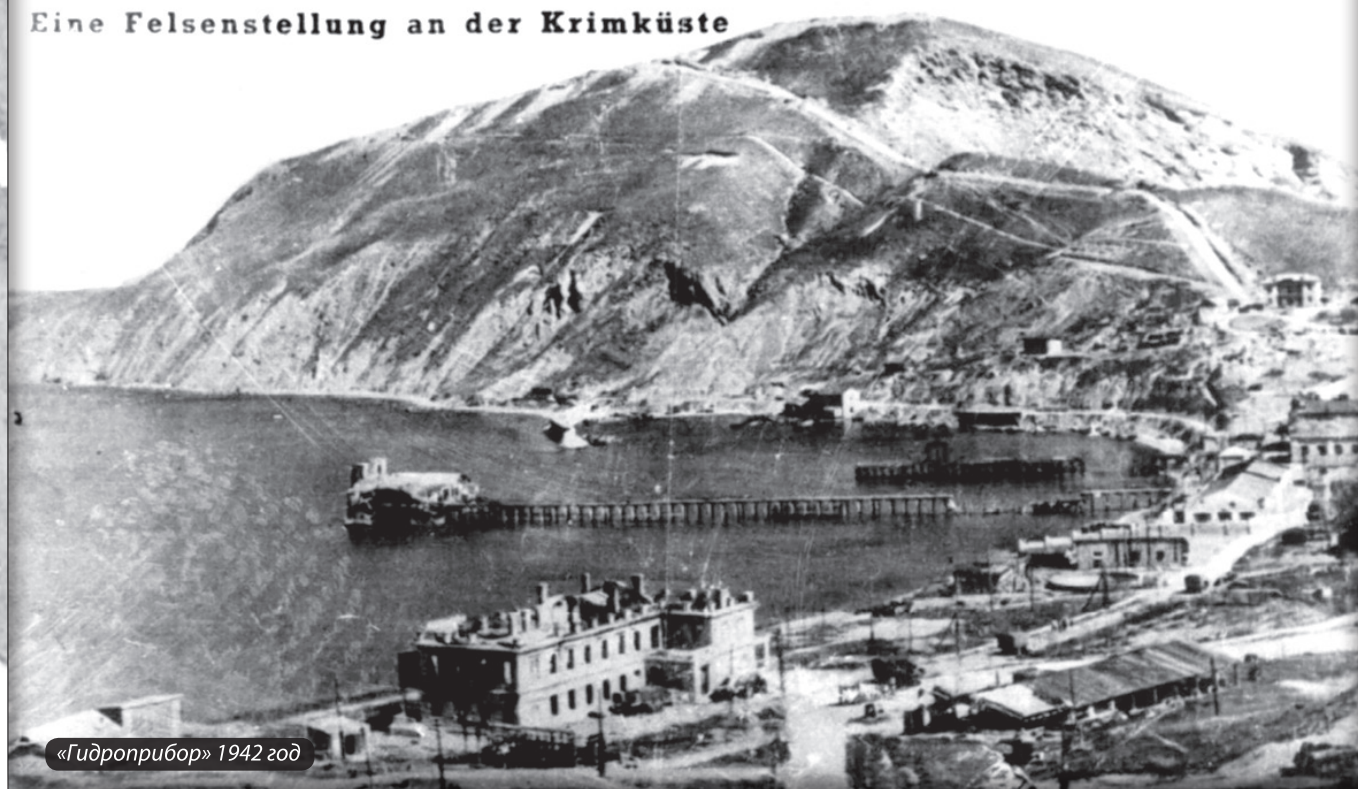
Eine Felsenstellung an der Krimküste

Ограничиваться одним морским сообщением невозможно, хотя бы в силу того, что далеко не всегда состояние моря это допускает. Знаю из собственной практики, что неделями нельзя было сообщаться с городом Феодосией морем, и если не было бы шоссе, вся станция была бы совсем отрезанной. Следовательно, сухопутное сообщение, безусловно, необходимо, а поэтому ремонт шоссе и постоянный надзор за ним должны быть осуществлены теперь же. Для сообщения с городом необходимы грузовики, легковой автомобиль и лошади с линейкой. Вопрос водоснабжения всегда был и остался самым болезненным и самым острым. Рассчитывать только на дождевую воду не приходится. При наличии 280 человек, считая на каждого по 2 ведра в сутки, расход воды в месяц может выразиться в количестве 16800 вёдер. Бассейн для сбора воды с крыш рассчитан на 7000 вёдер, т. е. этого запаса может хватить с натяжкой на 2 недели. Естественно возникает вопрос, каким же способом выйти из этого положения, выход был найден и следует им только воспользоваться – необходимо иметь водоналивную баржу на 3000 – 5000 вёдер и периодически доставлять воду из Феодосии».